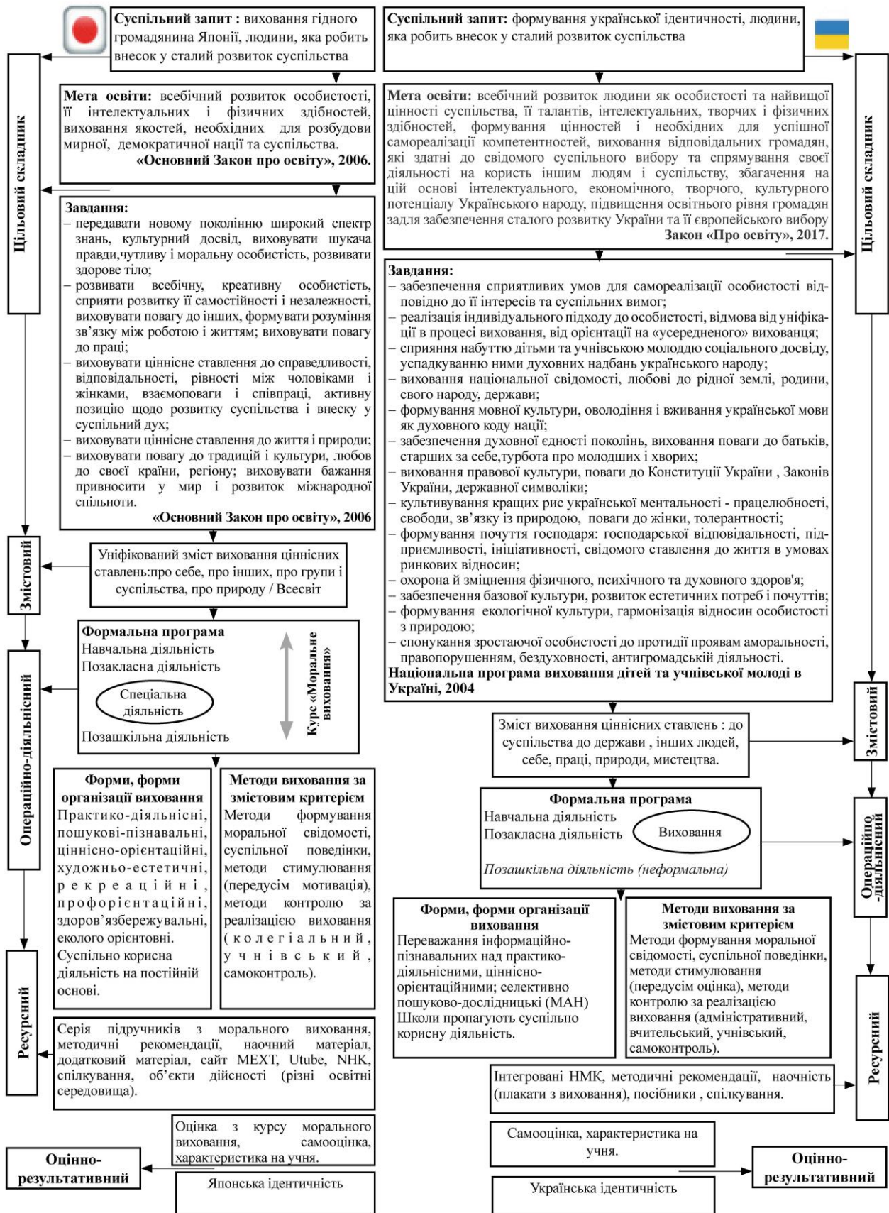
Схема реалізації змісту виховання ціннісних ставлень у школярів в Японії та Україні