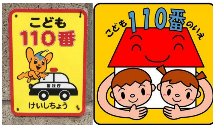
Рис.2.8: Знак «Дім 110» (CRICED, 2018).

Робота школи обов'язково передбачає її реальну співпрацю із територіальною громадою. У 3 і 4 класах початкової школи увага курсу «Соціальні науки» приділяється саме їй. На уроках морального виховання, інтегрованого навчання школи радо вітають представників місцевої громади, які діляться з дітьми своїм досвідом / майстерністю. Таких неформальних вихователів в японській школі називають « kokoro no sensei » – вчитель серця. Набуття досвіду міжкультурного спілкування і взаємодії із носіями мови (звична практика, коли школа співпрацює з носіями англійської мови, відомими в Японії, як ALT (асистент викладача, assistant language teaching ), участь у виховній роботі представників різних культур формують у японських школярів міжкультурне взаєморозуміння. Обов'язкове ж включення у шкільне життя елементів національної, регіональної і локальної культури (традиційна японська стрільба з лука ( kyu do ), каліграфія ( shodo ), японське фехтування ( kendo ), поезія хайку, гра на японських барабанах ( taiko ), шашки ( go ), ікебана; її міжпредметне вивчення, участь школярів у святкуванні місцевих і національних фестивалів, безумовно, вказує на реалізацію принципів культуровідповідності і етнізації, що спрямовані на формування у школярів національної самосвідомості, поваги до власної культури і традицій.