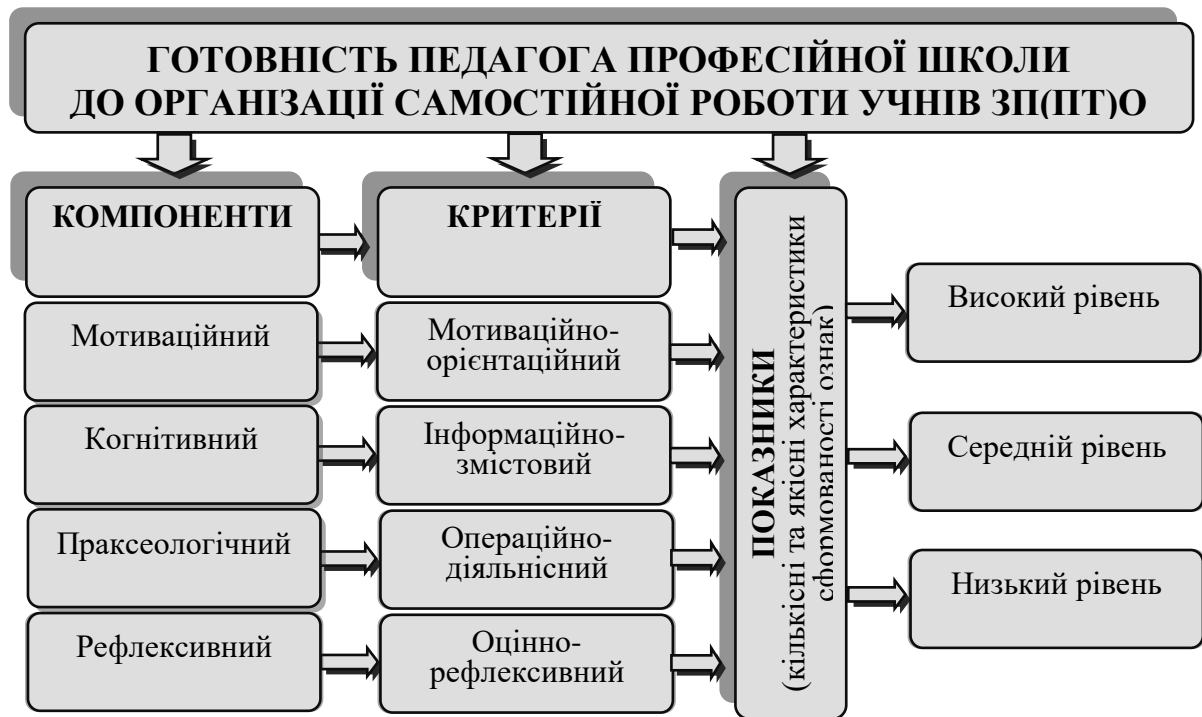
Рис. 1. Компонентно-критеріальна структура готовності майбутнього педагога професійної школи до організації самостійної роботи учнів ЗП(ПТ)О

Відповідно до основних компонентів структури готовності майбутніх педагогів професійної школи до організації самостійної роботи учнів ЗП(ПТ)О ( мотиваційного, когнітивного, праксеологічного, рефлексивного ) визначено критерії, показники та рівні її діагностики (рис. 1).