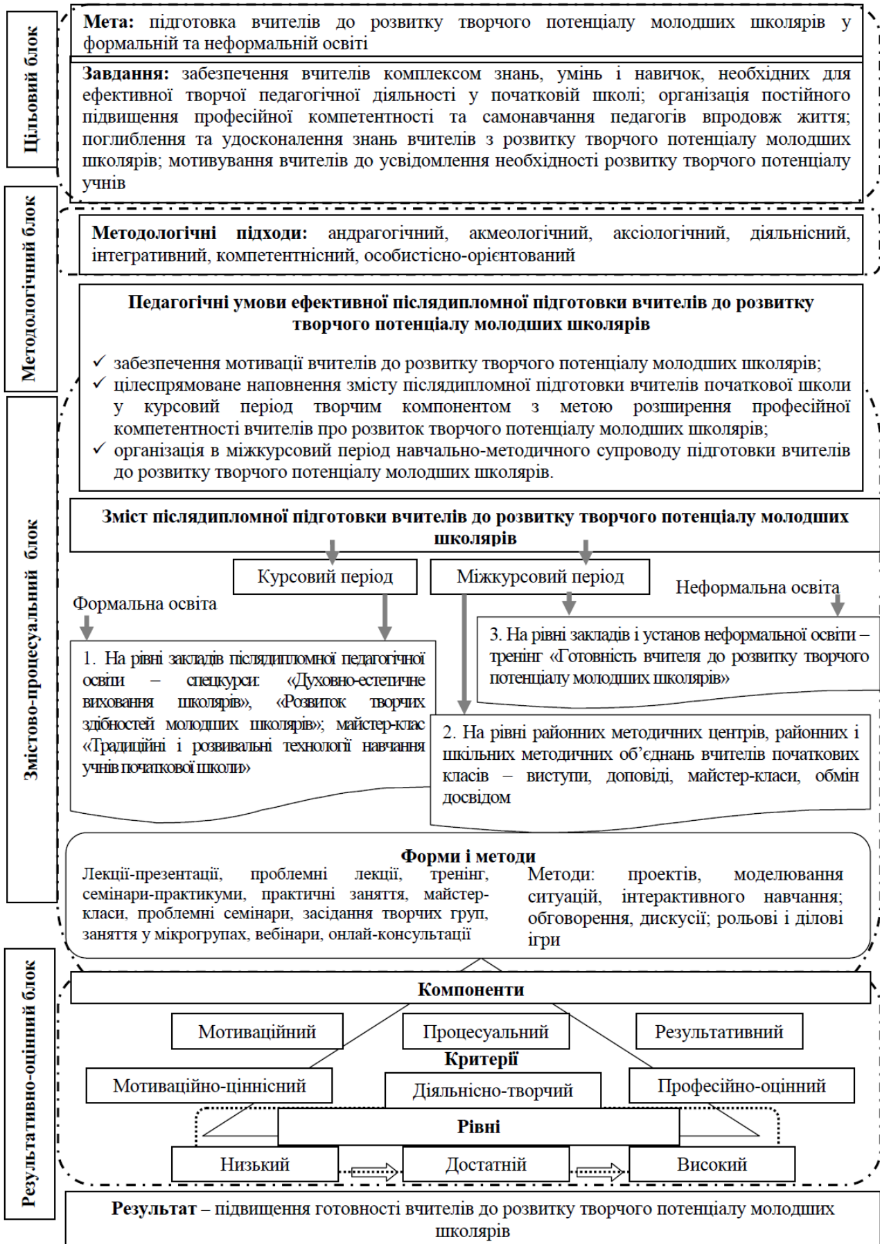
Рис. 1. Модель післядипломної підготовки вчителів до розвитку творчого потенціалу молодших школярів