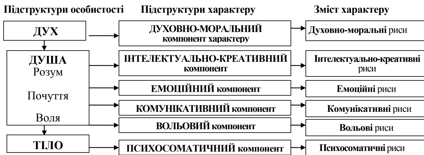
Мал. 2. Модель структури характеру особистості

Відповідно до підструктур особистості (духа, душі й тіла) структура характеру має 6 компонентів: духовно-моральний, креативно-інтелектуальний, вольовий, емоційний, комунікативний і психосоматичний (мал. 2). Кожний з компонентів містить відповідні дихотомічні (позитивні й негативні) риси – ознаки дисгармонійного або гармонійного характеру (табл. 1).